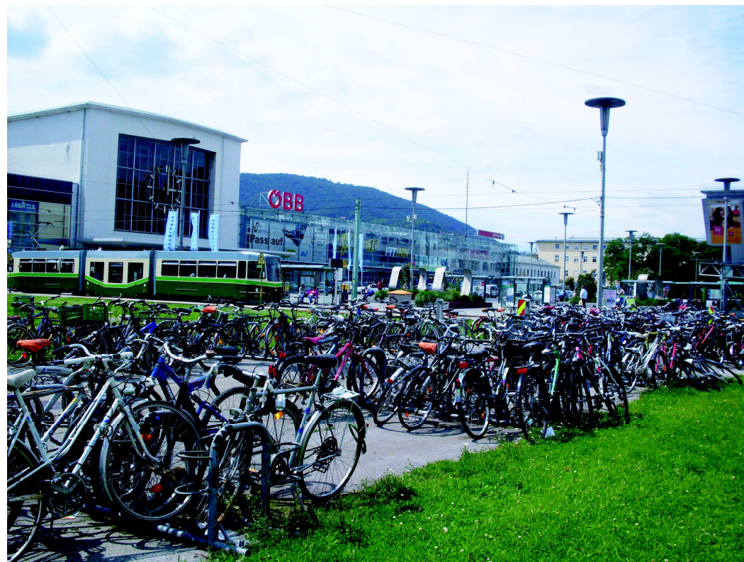
Dostupnost veřejných prostorů je základní podmínkou k jejich užívání. Koordinace všech druhů dopravy, zajištění komfortu a pocitu bezpečí je předpokladem dostupnosti prostorů. (Rakousko, Graz, foto Michaela Valentová, 2010)

Pravidla pro dopravu a zásobování budou upravována tak, aby jednotlivé systémy fungovaly provázaně jako celek s cílem posilovat obyvatelnost území. Dopravní prostor musí být uspořádán a dimenzován tak, aby byl organickou součástí veřejného prostoru.