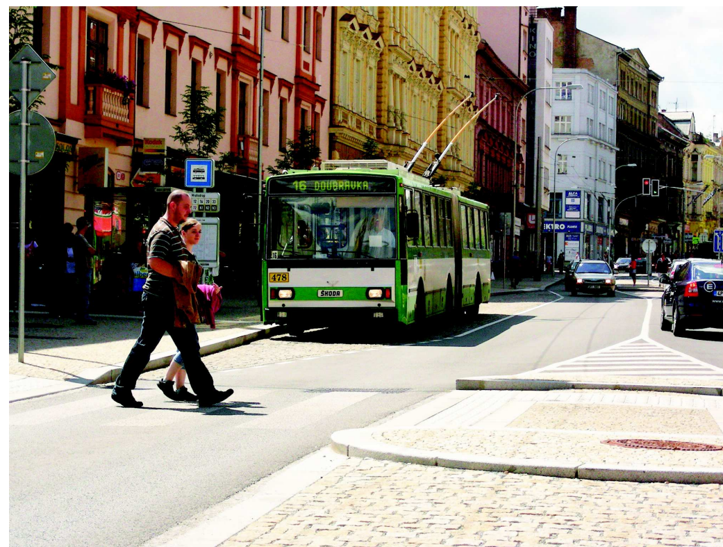
Pocit bezpečí ve veřejném prostoru je podmínkou číslo jedna. Vhodné je jej řešit např. stylem architektury, členěním prostoru, organizací dopravy a především mezi zapojením dotčených uživatelů – tedy chodců, cyklistů i motoristů. (Plzeň, Americká třída, foto Magdalena Hledíková, 2009)

Subjektivní pocit bezpečí je posilován vytvářením příjemného prostředí a společenským dohledem. Pociť bezpečí je třeba posilovat řešením a organizací veřejných prostorů, motivací různých typů aktivit a využití i podporou společenské kontroly.