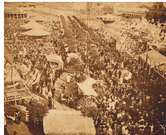
Posvícení ve Vršovicích 1924

Podporovat a umožnit konání tradičních akcí a místních aktivit (obnovovat zaniklé trhy, slavnosti, případně podporovat vznik nových).