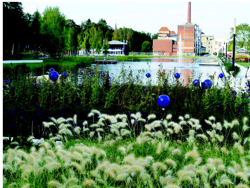
Areál bývalé textilní továrny Benker spolu s částí lužního lesa byl změněn na multifunkční prostor pro kulturní aktivity, volný čas a osvětlu. Při tom byly zachovány hodnoty původní průmyslové architektury. (SRN, Marktrechwitz, foto Petra Žerebáková, 2006)

Místních zdrojů lze využít jak při hospodaření s přírodními zdroji (srážkovou vodou, sluneční energií), tak i využitím lidských zdrojů, jako jsou místní podniky, zájmová sdružení nebo školy.