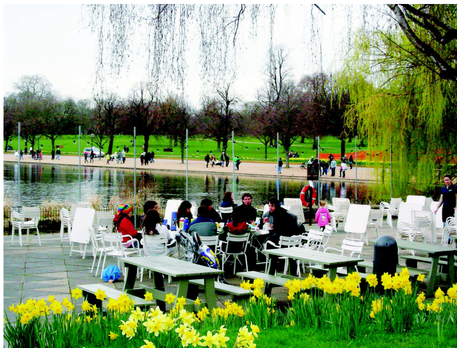
Zahrady a parky patří mezi příjemné, proměnlivé i jedinečné prostory jak pro lidi, tak pro živočichy. Tato místa mají velký význam z pohledu lidského zdraví a z pohledu společenského. Pro obyvatele měst jsou to místa setkání i aktivního odpočinku. (Velká Británie, Londýn, Hyde Park, foto Magdalena Hledíková, 2010)

Veřejné prostory mají být přívětivé svým vzhledem, uspořádáním, míšením funkcí, přehledností a celkovou pobytovou využitelností. Veřejné prostory mají být příjemné pro vnímání všemi lidskými smysly, tedy co nejméně hlučné, co nejméně prašné, s vyváženým a logickým podílem přírodních prvků. Veřejné prostory mají nabízet příjemné zážitky, včetně chuťových, čichových i hmatových.