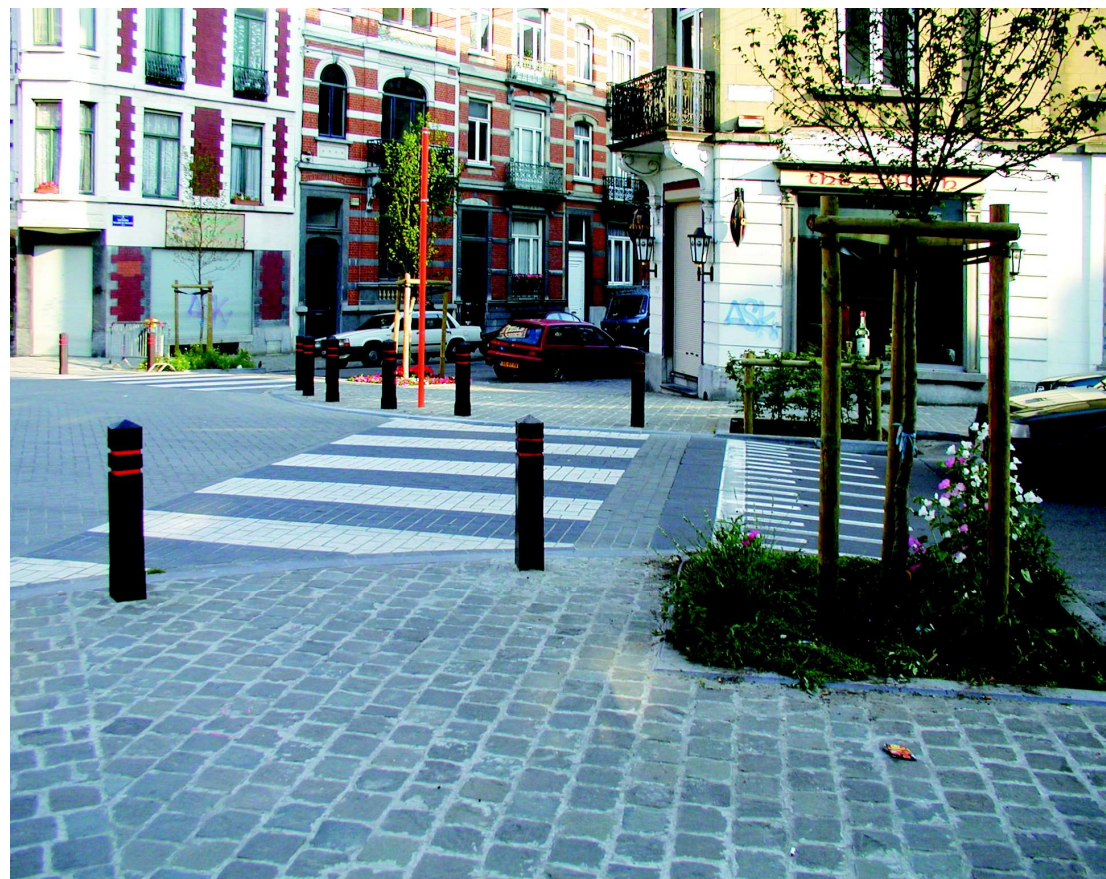
Veřejné prostory jsou řešeny tak, aby se chodec cítil bezpečně, tedy jsou přehledné, srozumitelné a v lidském měřítku. (Belgie, Bruxelles, Rue Stevin, foto Kamil Kubiš, 2002)

Veřejné prostory budou pro lidi srozumitelné v typu, účelu, významu a v propojení s jejich okolím. Uspořádání prostoru musí být srozumitelné a logické, pěší cesty musí být přirozené a přímé, bez bariér a oklik.