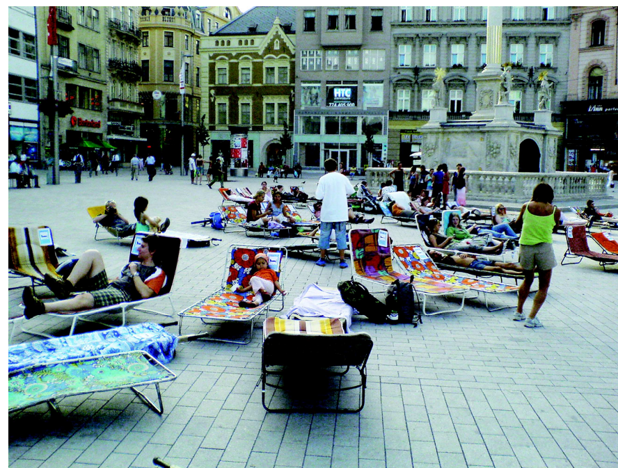
Veřejné prostory jsou atraktivní, když jsou využívány, když zde lidé náhodně či cíleně sdílejí svůj čas a nápady. Svoboda projevu a komunikace je nejen známkou demokratického prostoru, ale i kořením života na veřejných prostorech. (Brno, Náměstí Svobody)

Veřejné prostory budou přizpůsobeny možnostem užívání všemi skupinami včetně těch slabších, jako jsou senioři, děti a dospívající, maminky s dětmi, obyvatelé s handicapem. V této souvislosti je třeba dbát zejména na bezbariérová řešení a odstraňování bariér sociálních. Místa musí být vybavena infrastrukturou umožňující pobyt různých skupin.