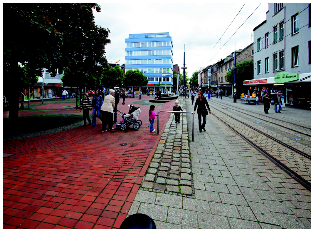
Veřejné prostory jsou hierarchizované podle významu a funkce, jsou mezi sebou propojené a zároveň jasně čitelné. Prostory určené pro dopravu či trávení volného času jsou oddělené vizuálně, koordinovány v čase a prostoru. (SRN, Witten, Bahnhof Strasse, foto Kamil Kubiš, 2009)

Veškeré aktivity ve veřejných prostorech či aktivity směřující k jejich správě a rozvoji musí být koordinovány s cílem zajistit funkčnost systému, např. vyváženost jednotlivých druhů dopravy, vyváženost aktivit, služeb a příležitostí. Řešení musí mít předem stanovené priority a zásady.